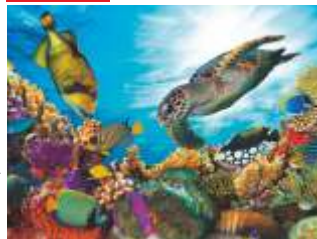
Megfelelő kétirányú nyomtatás és előtolás beállítás