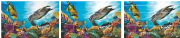
Helytelen, kétirányú nyomtatás beállítás Átfedés, csíkok jelennek meg (túl alacsony az előtolási érték) Hézag, fehér vonalak (túl magas az előtolási érték)

Bevezetésre kerül az új DAS funkció, amely automatikusan elvégzni a kétirányú nyomtatás és média előtolás beállításokat. Ezzel időt tud megtakarítani és képes növelni a produktivitást.